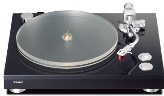
写真はダストカバーを外した状態です。