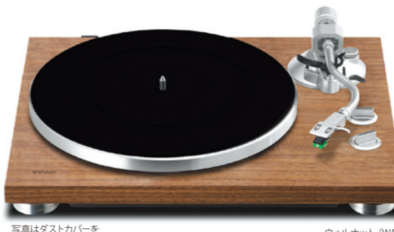
写真はダストカバーを外した状態です。