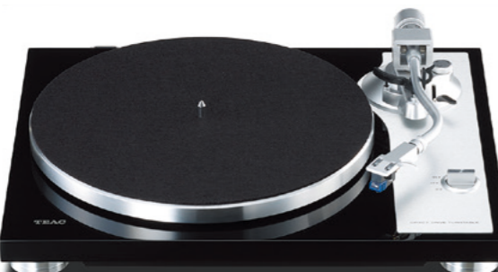
写真はダストカバーを外した状態です。