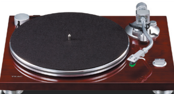
写真はダストカバーを外した状態です。