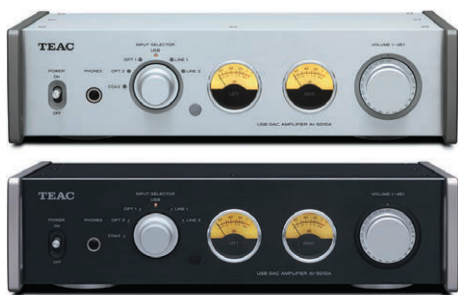
USB DAC/ステレオプリメインアンプ AI-501DA