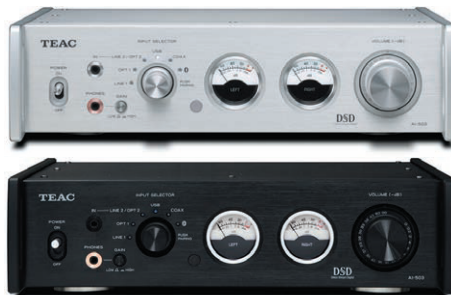
USB DAC/ステレオプリメインアンプ AI-503